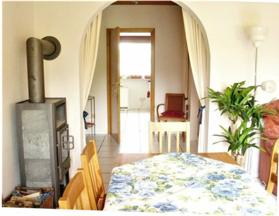
Blick vom Wohnzimmer