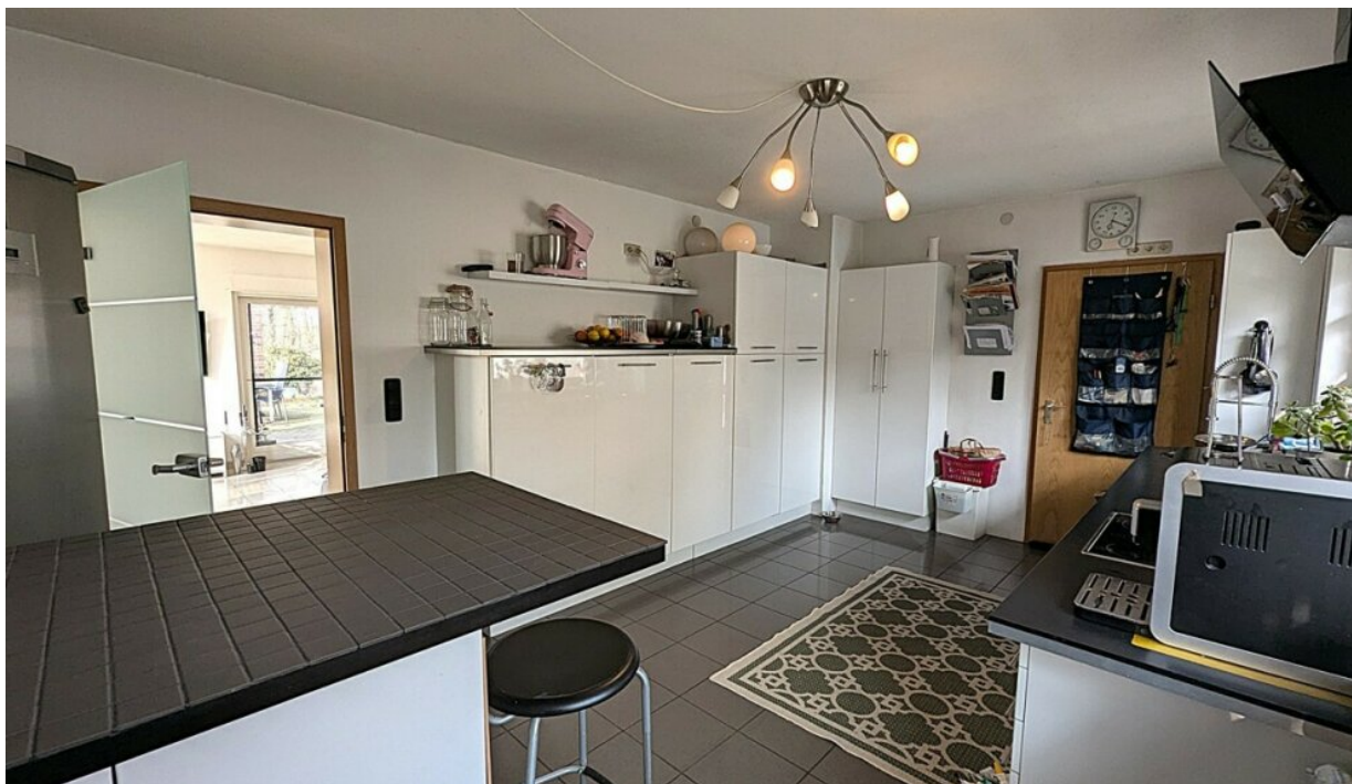
EG moderne Küche