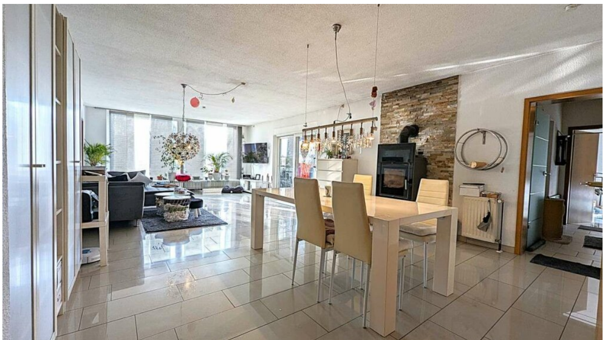
EG Lebensraum mit funktionalem