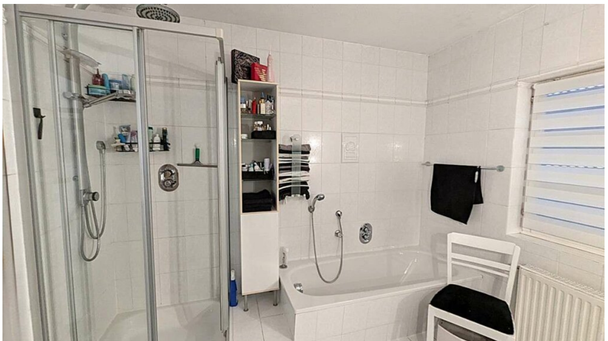
EG tiefer gelegte Badewanne un