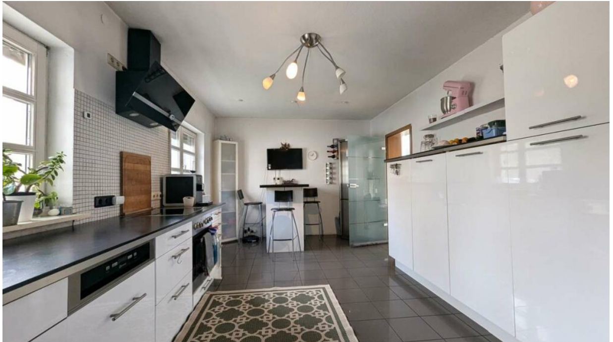
EG moderne Küche mit Tisch