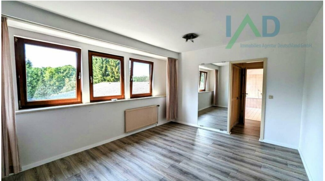
OG Schlafzimmer mit Ankleide v