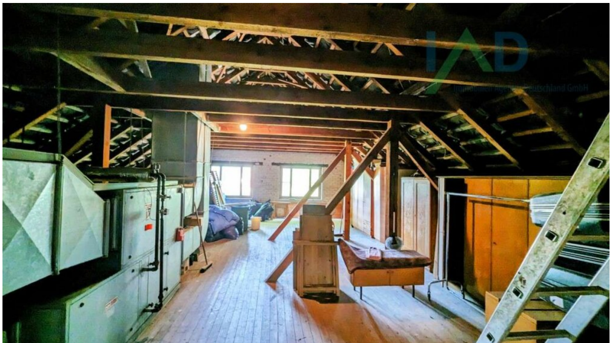
OG Ausbaureserve auf Dachboden