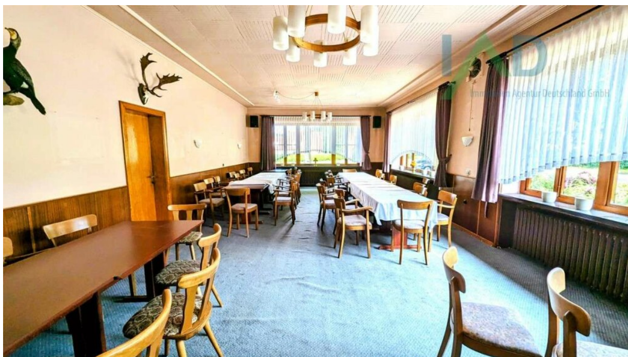
Speisesaal mit Bestuhlung