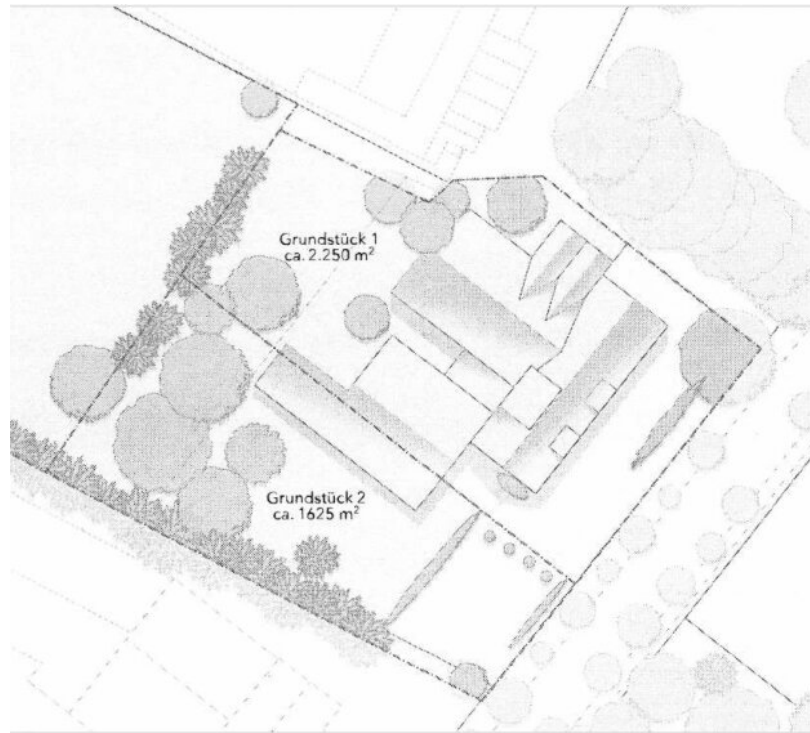
Grundstücke und Altbestand