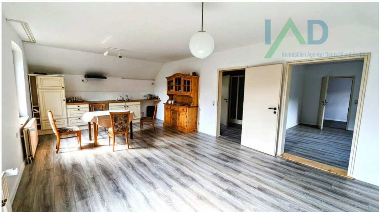
OG große Wohnküche