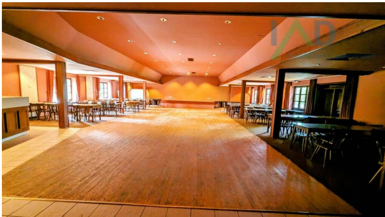
Saal mit Bestuhlung