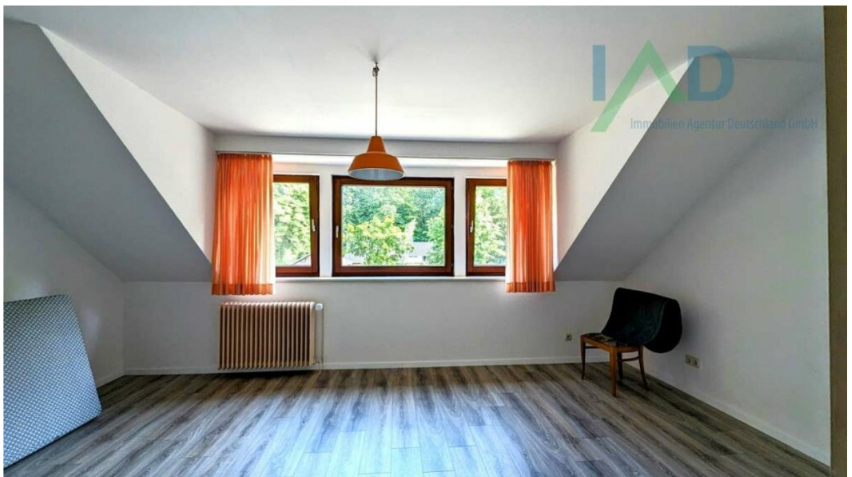
OG großes Extra-Zimmer im Extr