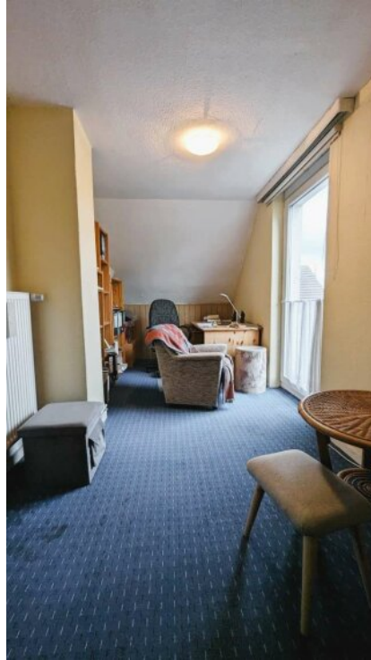
Kinderzimmer mit Dachterasse