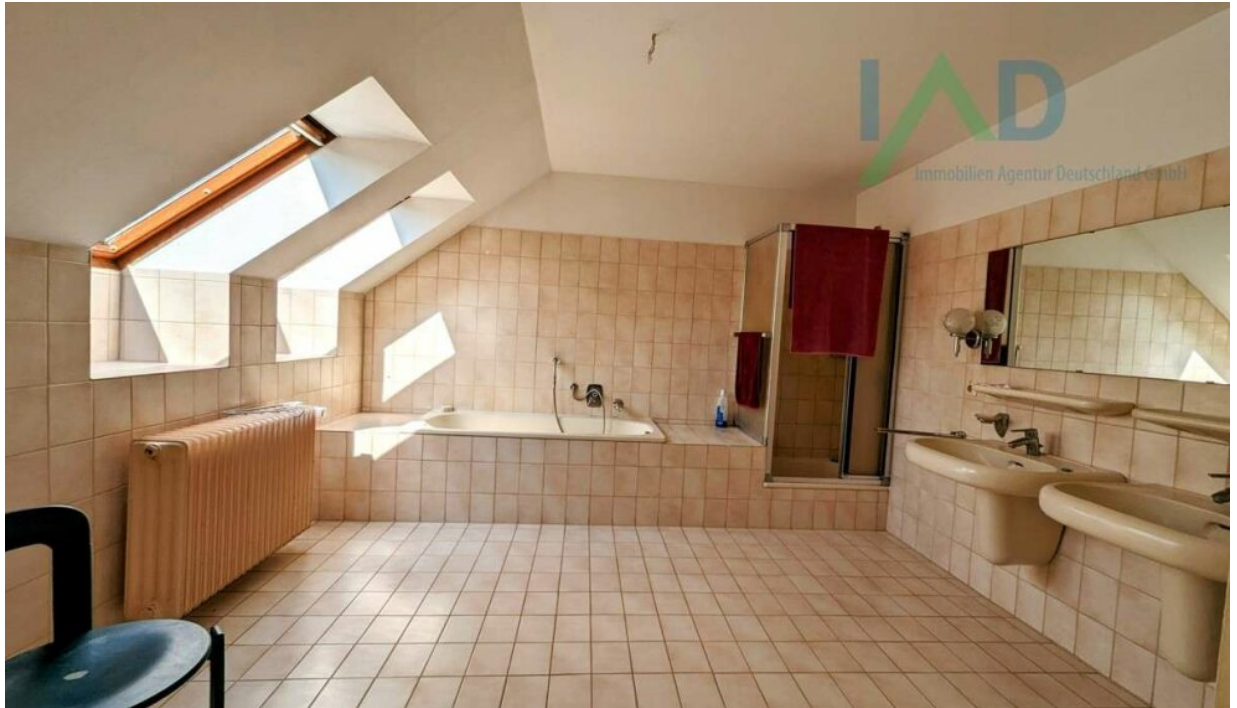
OG großes Bad