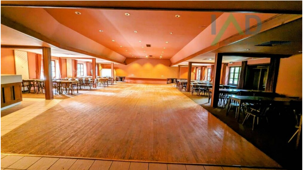
Saal mit Bestuhlung