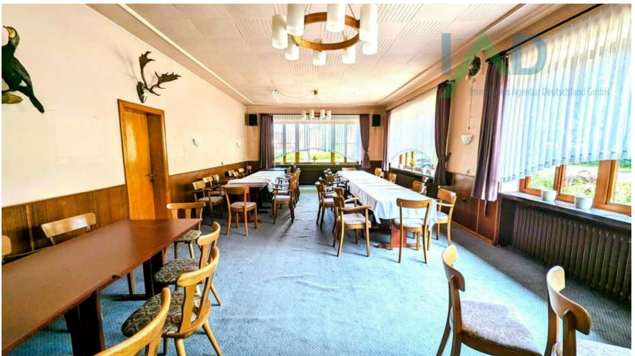
Speisesaal mit Bestuhlung