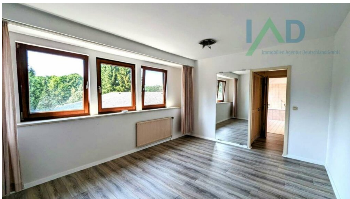
OG Schlafzimmer mit Ankleide