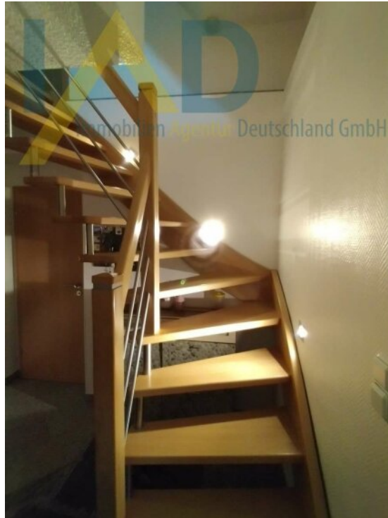
Treppe zum OG