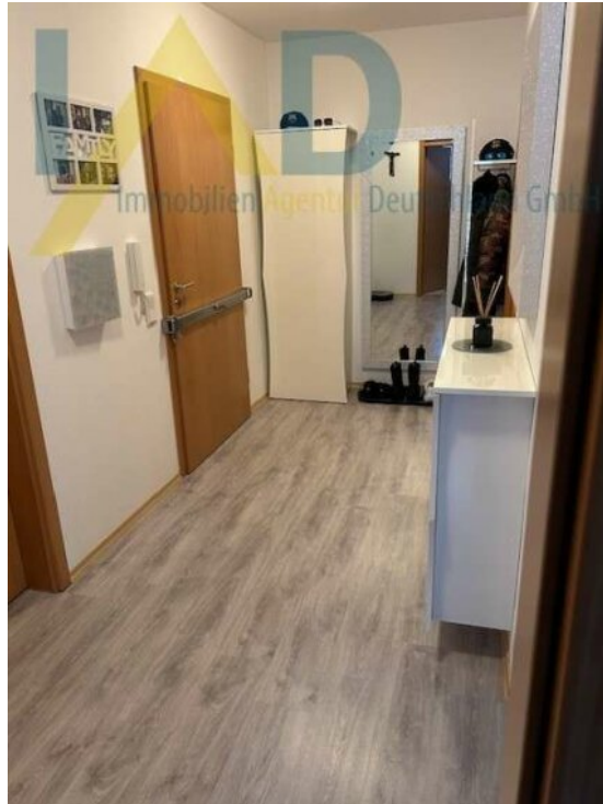
Flur m. Garderobe