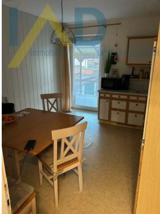
Küche mit Essplatz