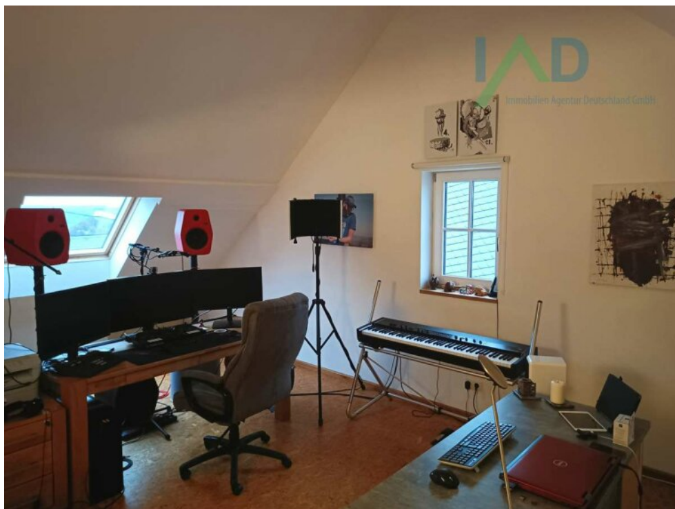
Büro im Dachgeschoss