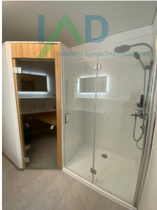
Bad mit Sauna