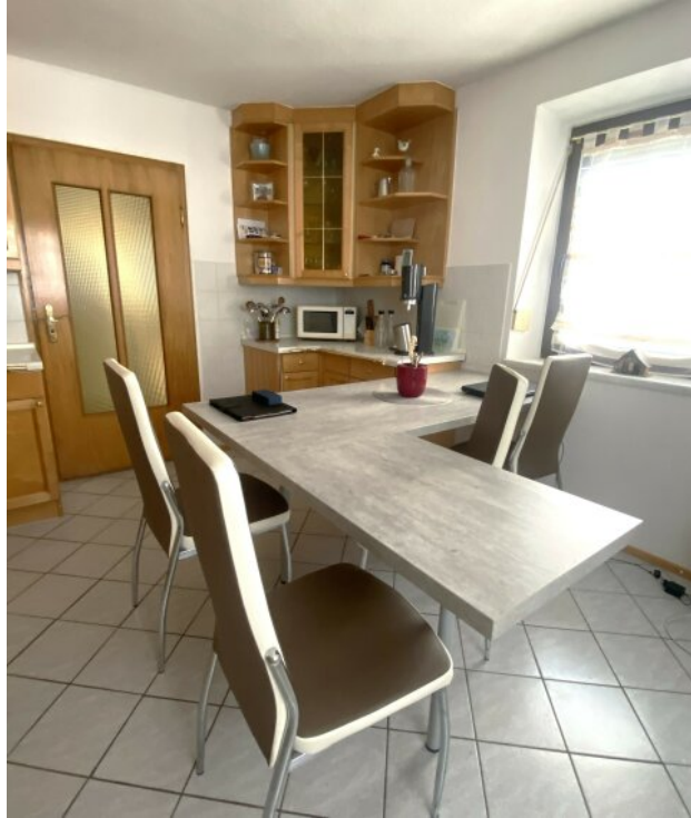
Küche / Essbereich