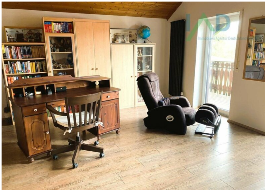
Wohnen / Büro