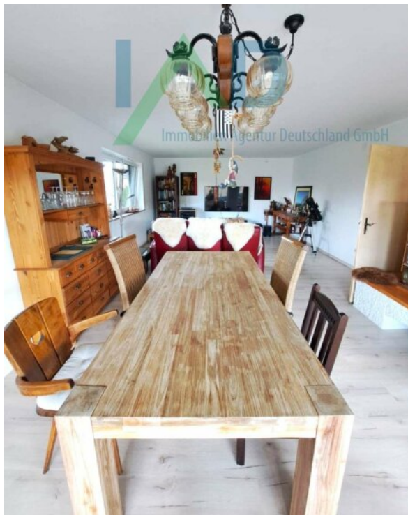
Wohnen / essen