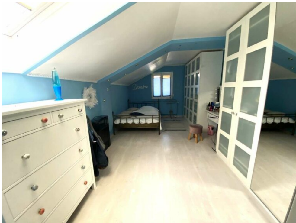
Kinderzimmer / Büro