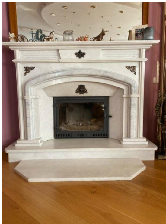
Kamin im Wohnzimmer