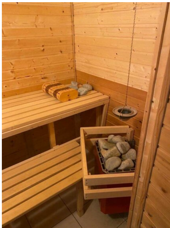
Sauna im Keller