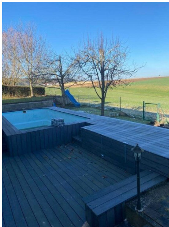
Pool / Garten