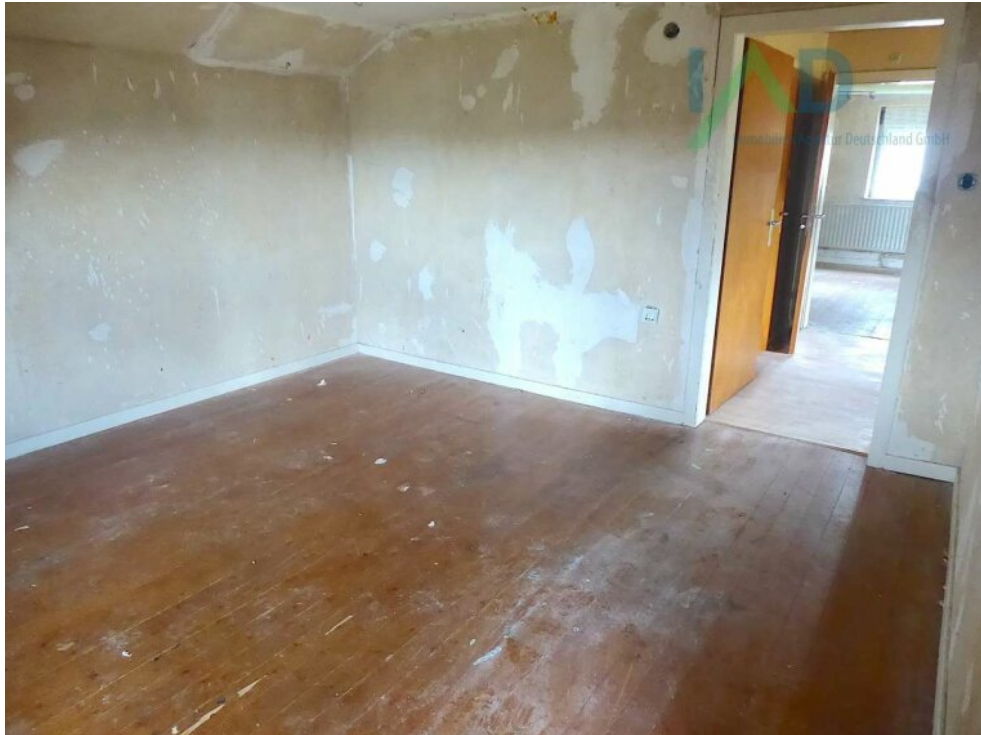
Durchgangszimmer II im OG