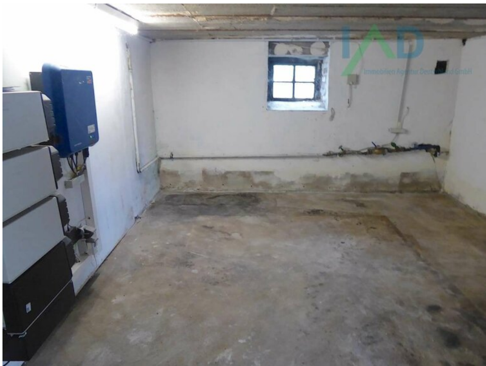
Kellerraum mit Anschluss Photo