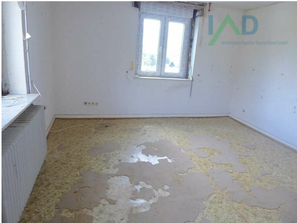
Raum I EG