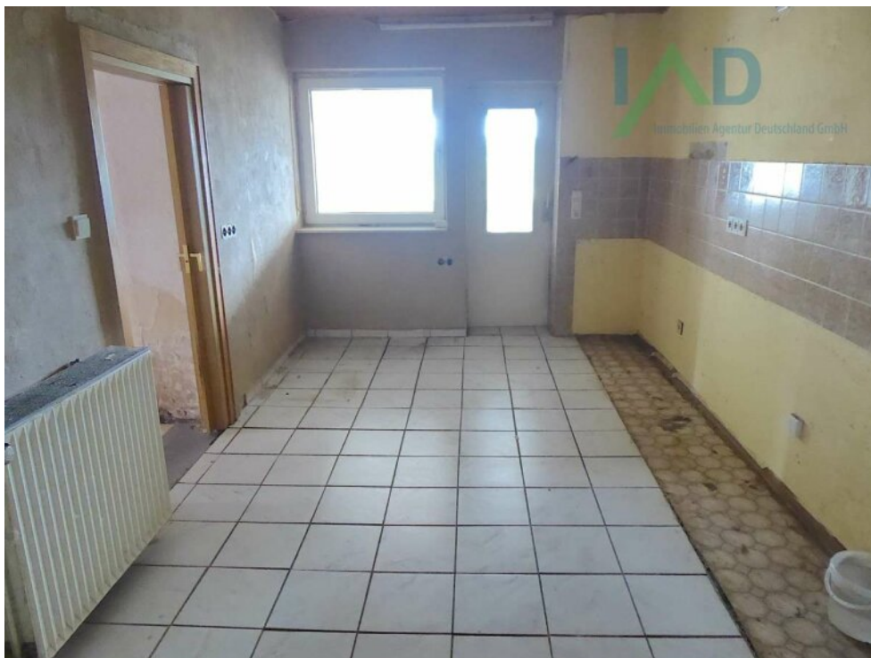
Küche mit Zugang Wintergarten