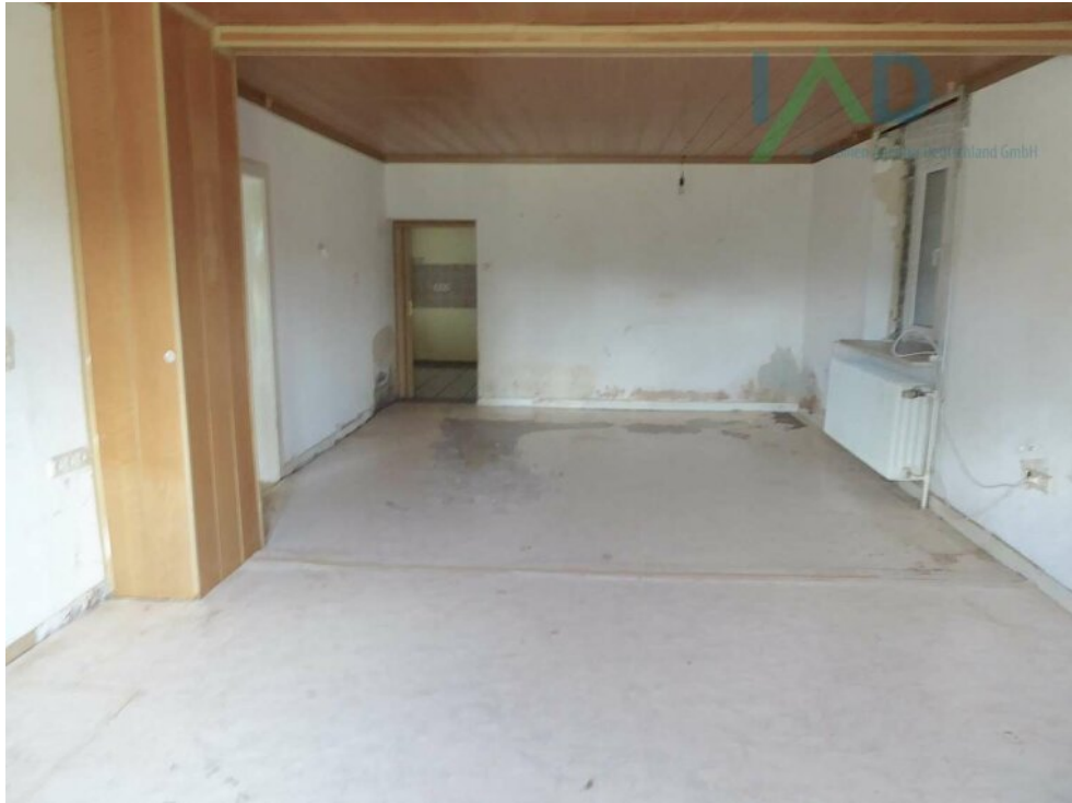
Wohnzimmer mit Eingang Küche E