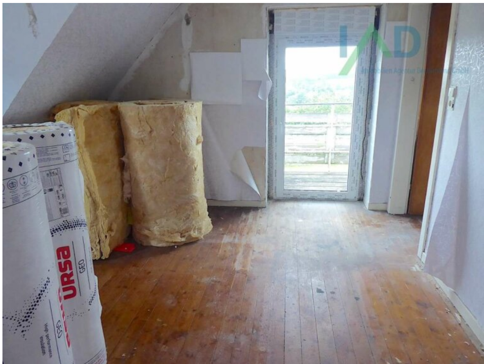
Zimmer hinter Durchgangszimmer