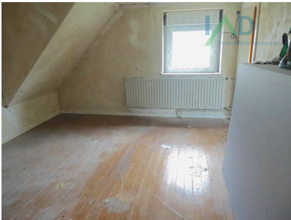
Durchgangszimmer I OG rechts