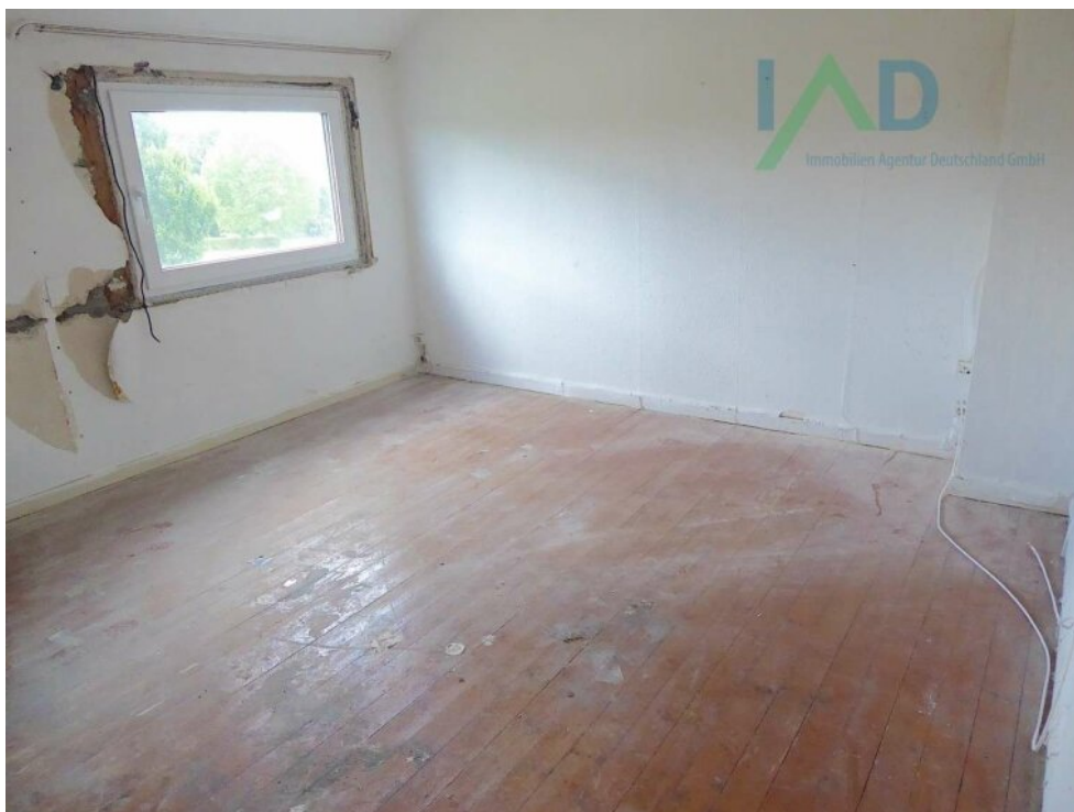
Raum hinter Durchgangszimmer I