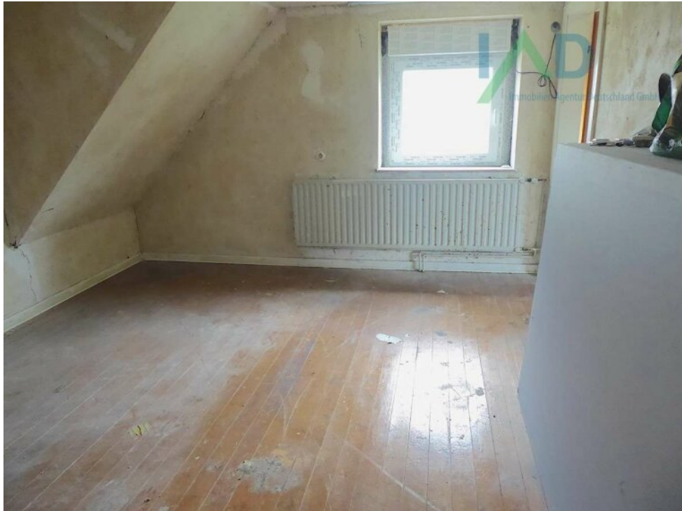
Durchgangszimmer I OG rechts