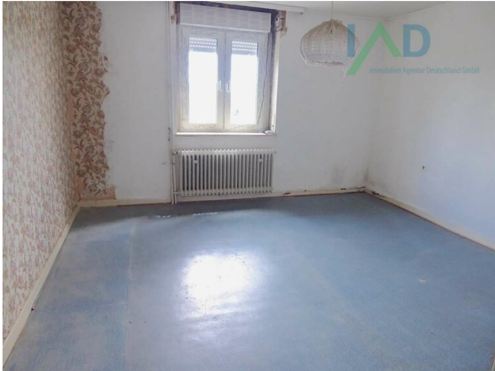
Raum II EG