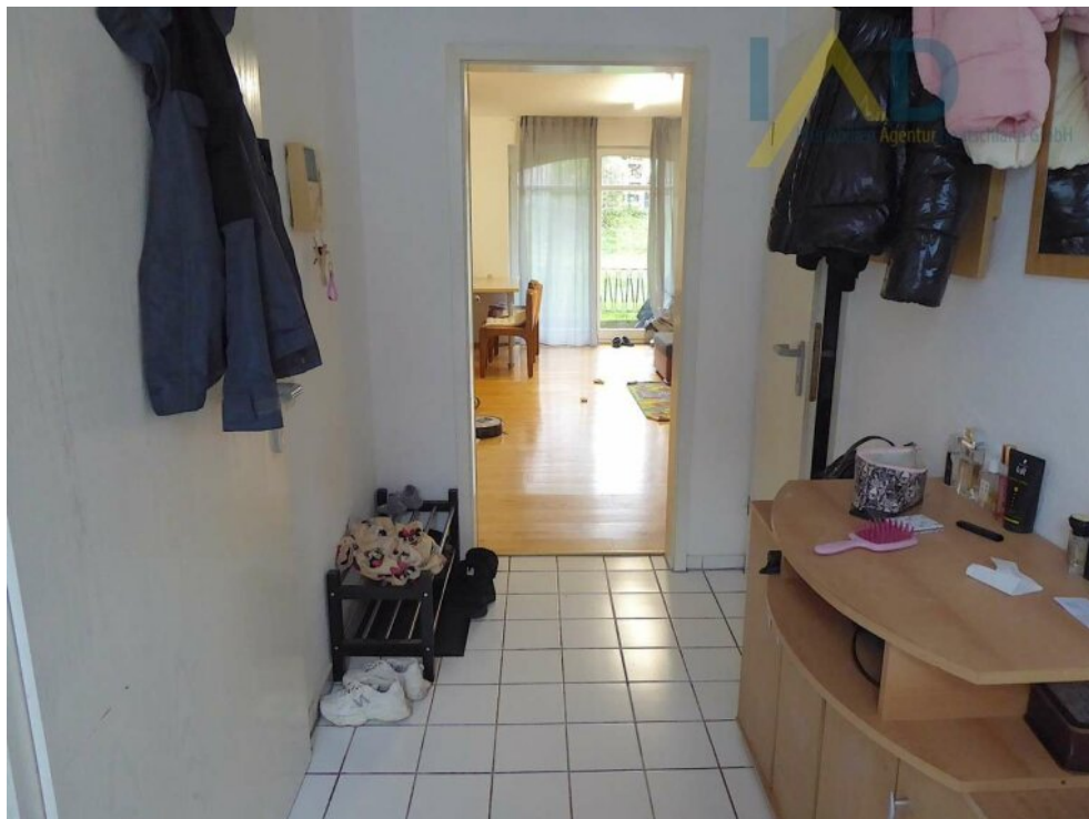
Blick aus dem Flur ins Wohnzim