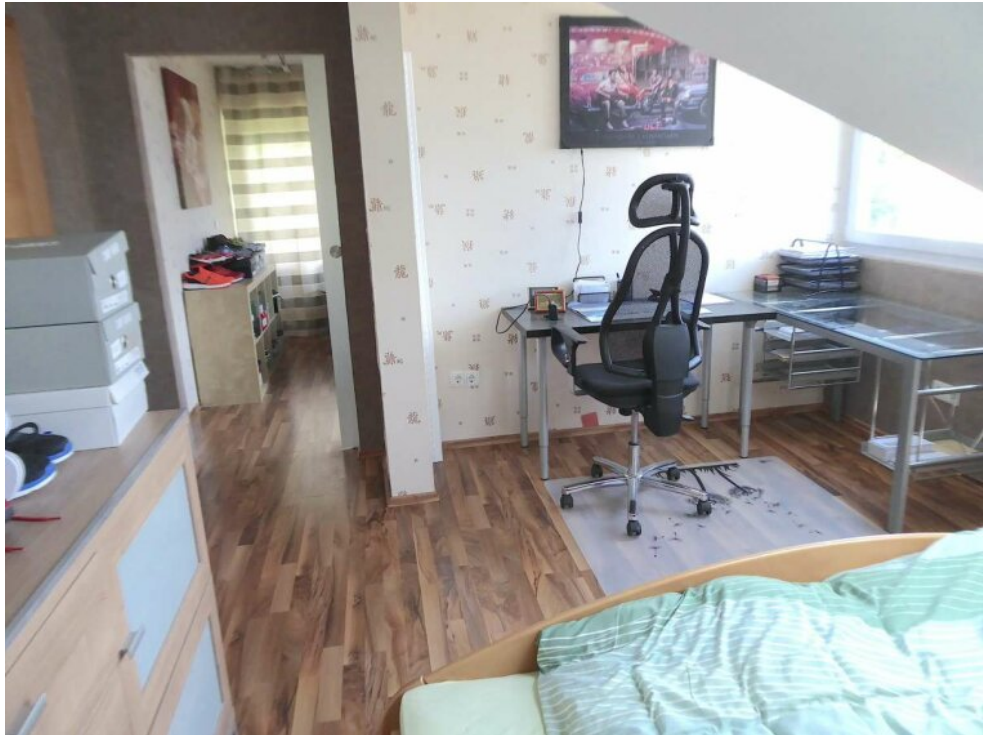
Schlafzimmer I DG