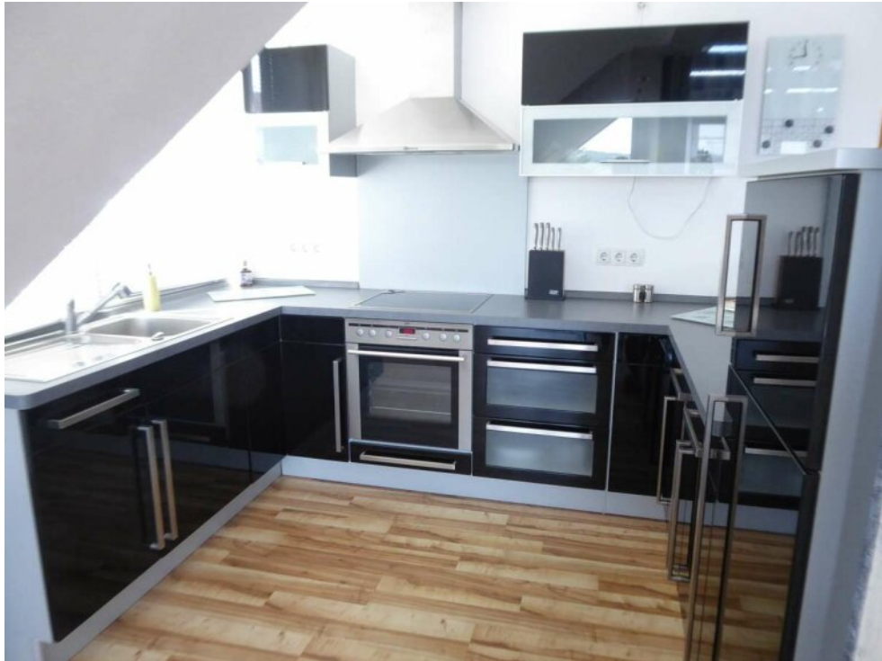
Küche mit EBK OG