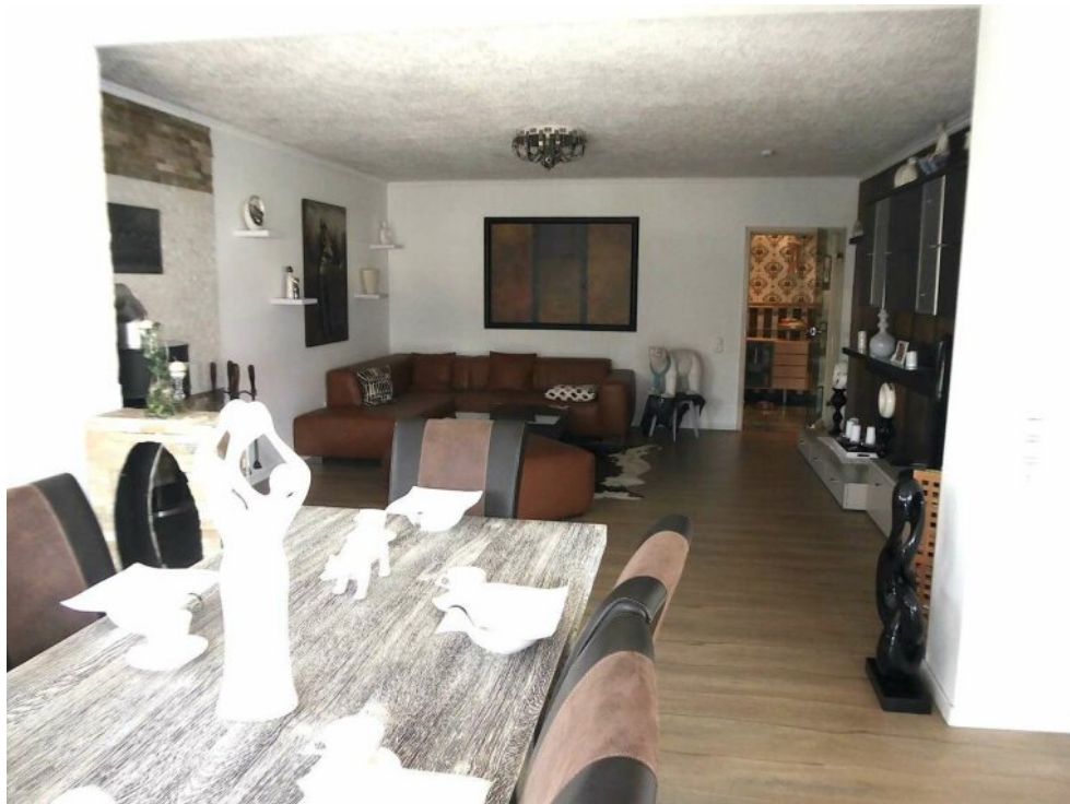
Wohnzimmer mit Essbereich