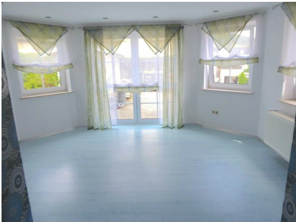
Erker Wohn-Schlafbereich UG