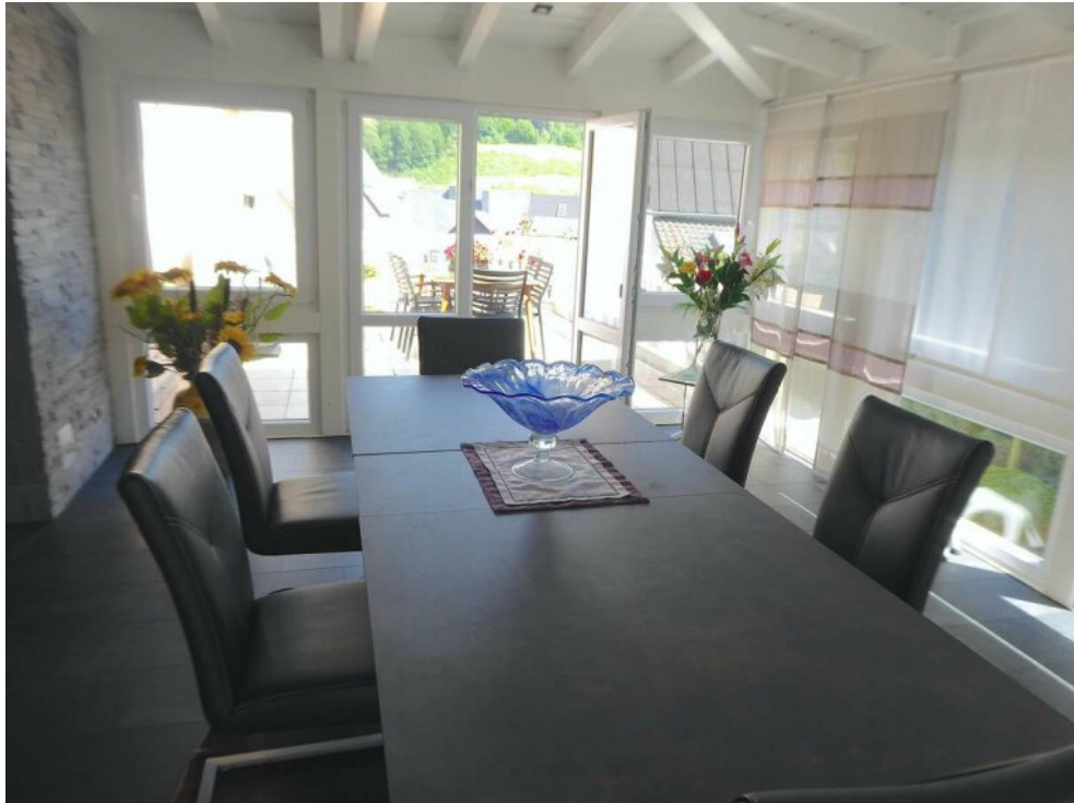
Essbereich/Wintergarten mit Au