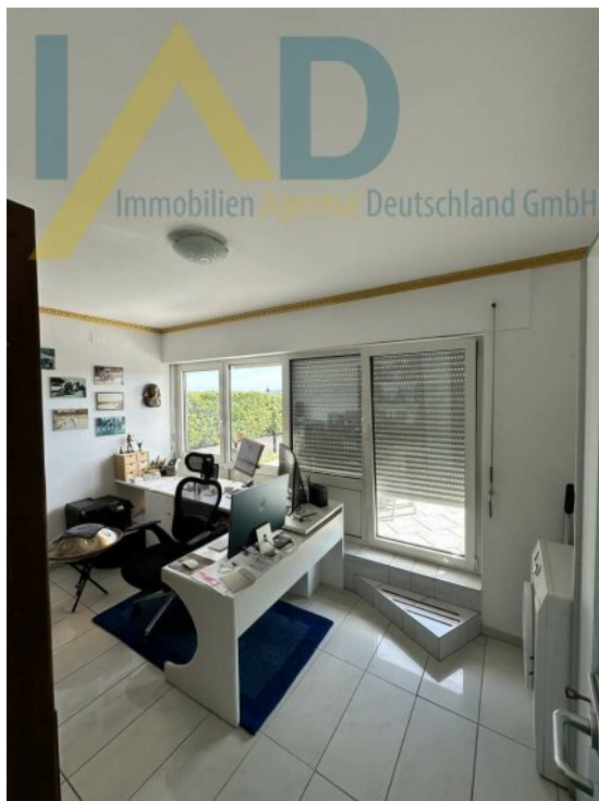
Gästezimmer / Büro