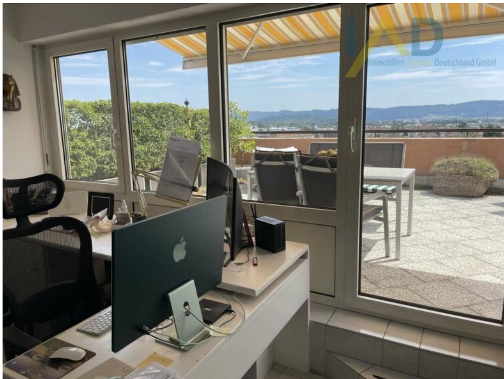
Arbeitszimmer / Gästezimmer Sü