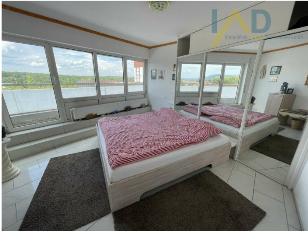
Schlafzimmer Ausrichtung Norde