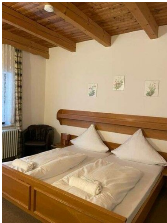
Zimmer 1 Bodenmais