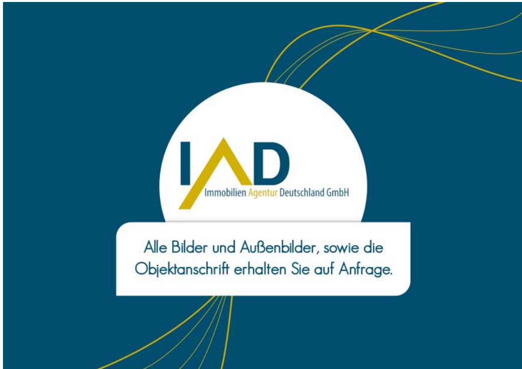
Bilder auf Anfrage (3)