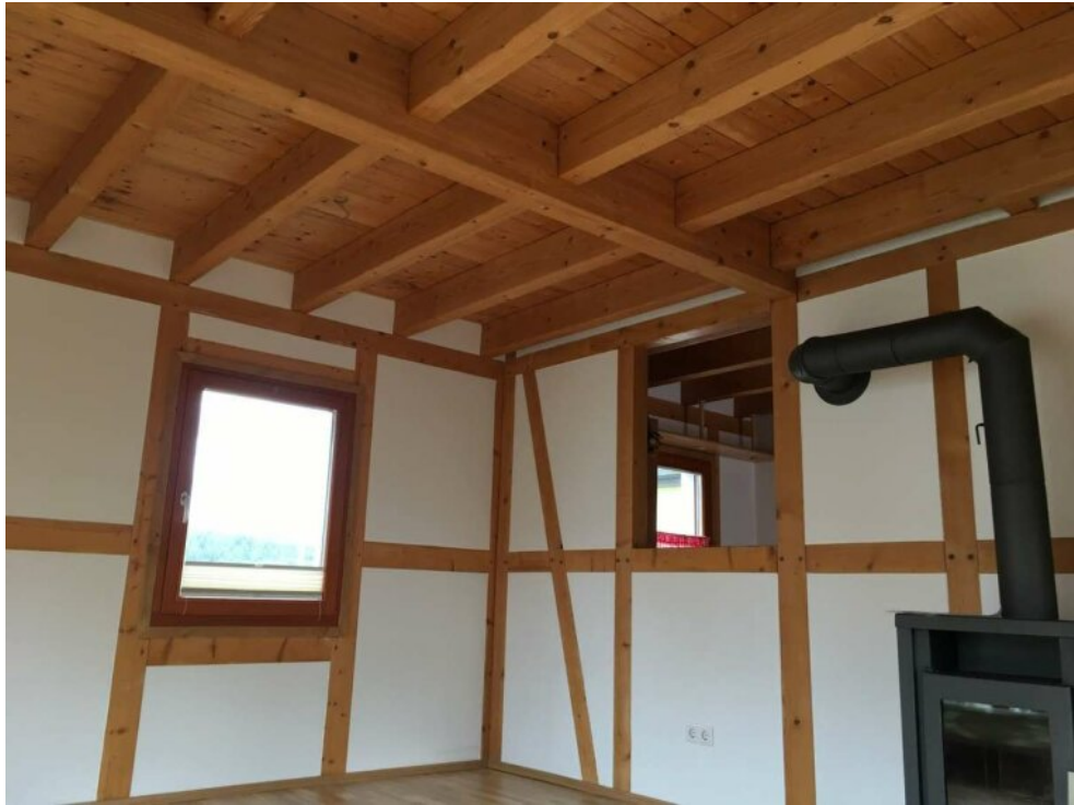
Innen nach Restaurierung