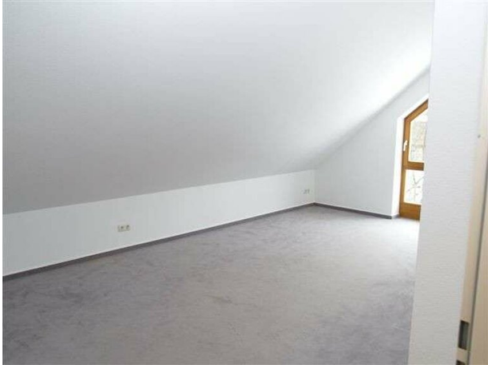
DG2 Schlafzimmer 1a