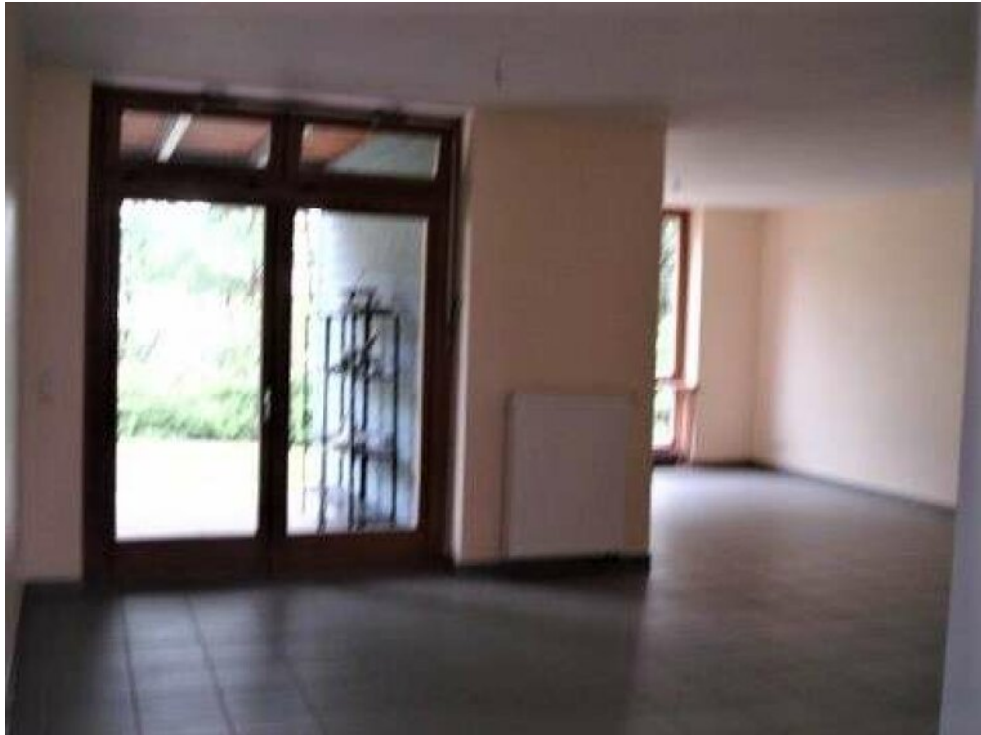
EG1 Wohnen-Essen rechts