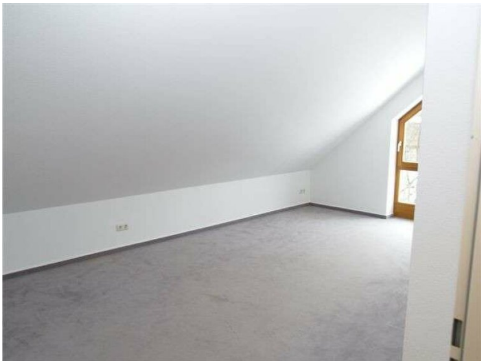
DG2 Schlafzimmer 1a