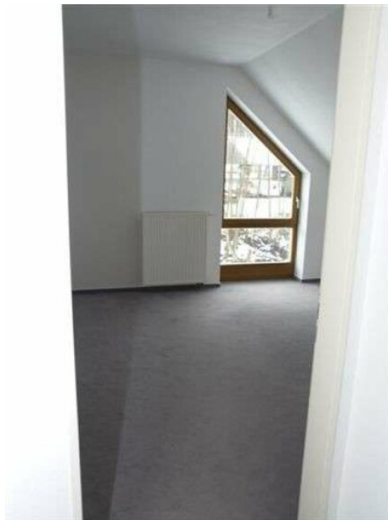
DG2 Schlafzimmer 2