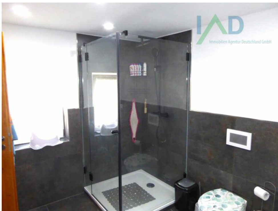
Tageslicht Bad Dusche OG