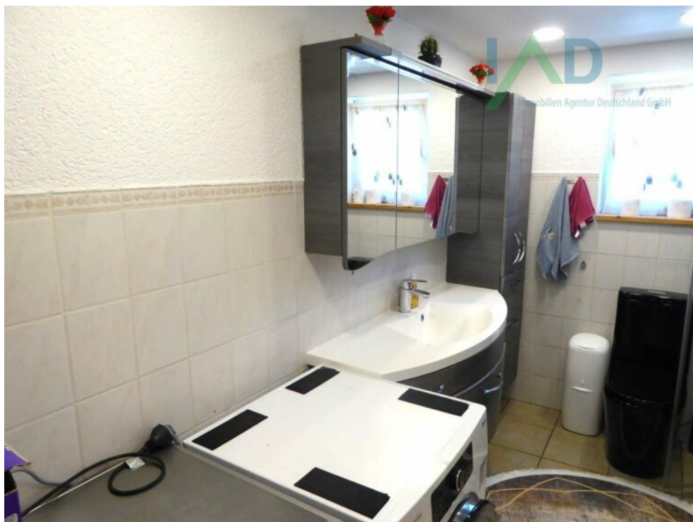
Tageslicht Bad EG