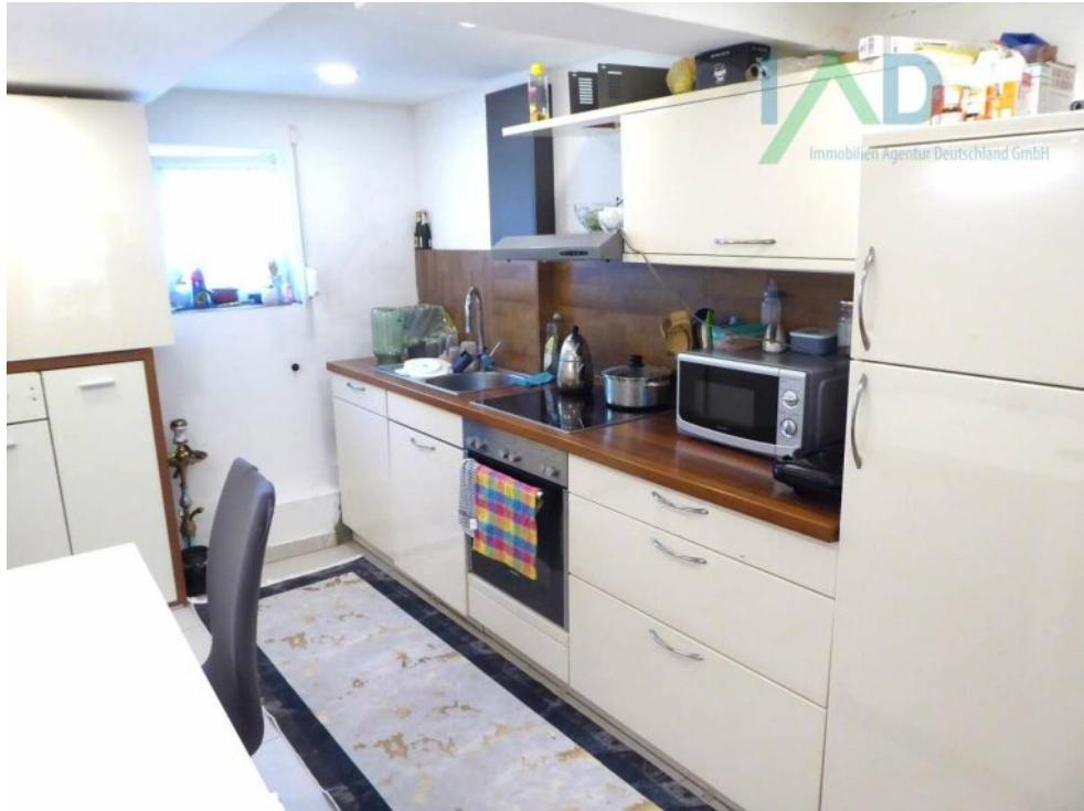
Küche mit Essecke