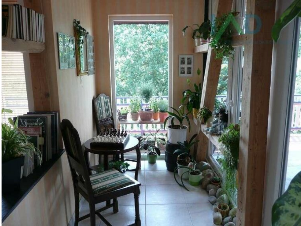
Flur Zugang Freisitz