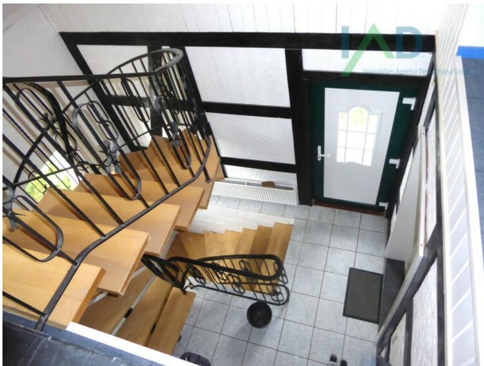
Eingang und Flurbereich