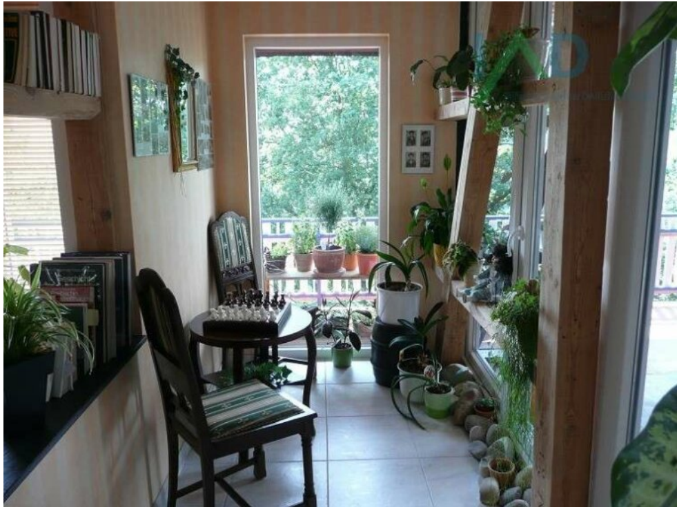
Flur Zugang Freisitz