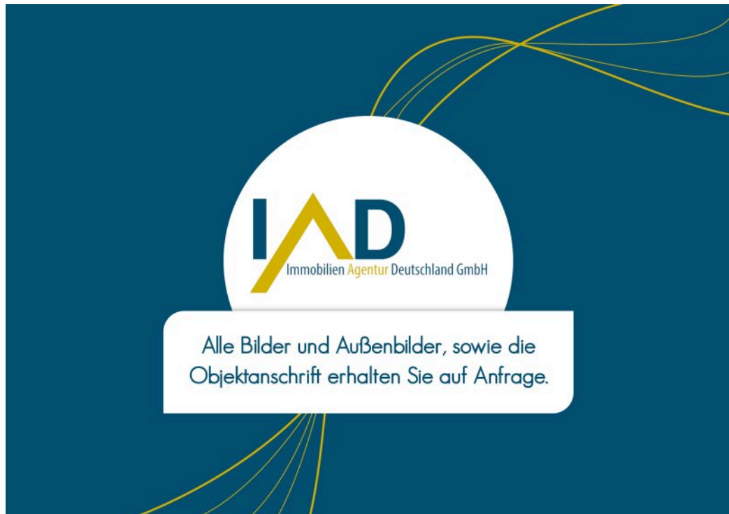
Bilder auf Anfrage