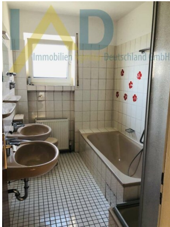
Tageslicht Bad mit Wanne und D