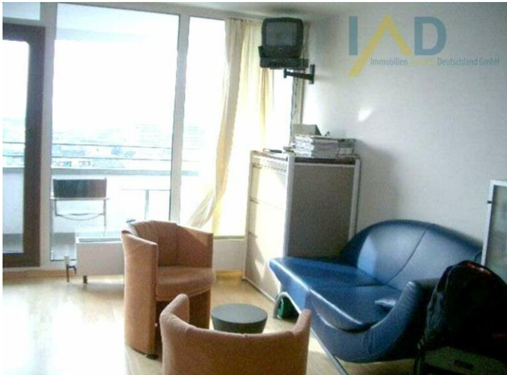
Wohn- Schlafbereich Ausgang Ba