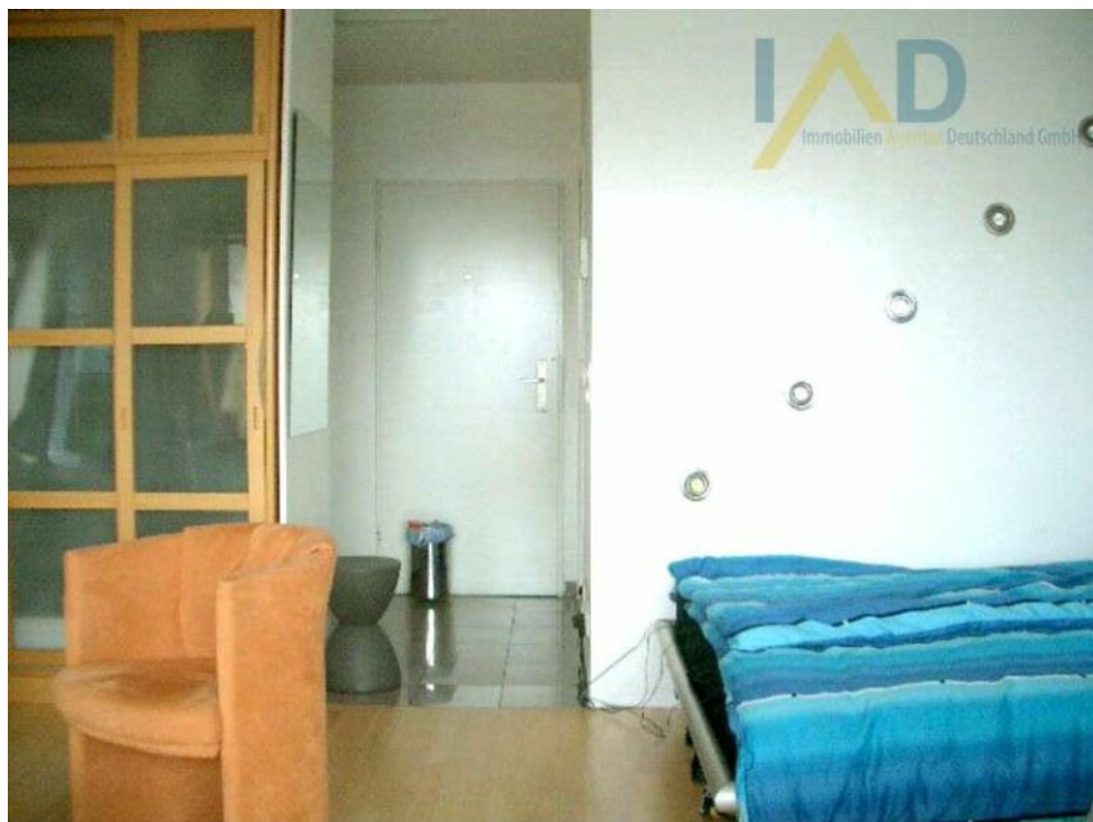
Wohn- Schlafbereich Eingang