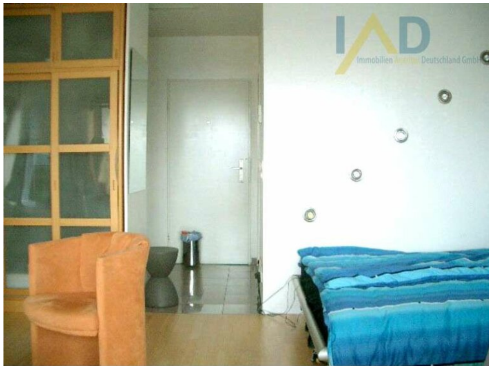
Wohn- Schlafbereich Eingang