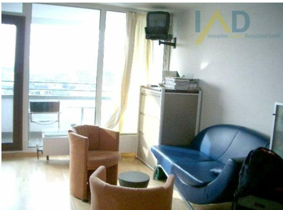
Wohn- Schlafbereich Ausgang Ba