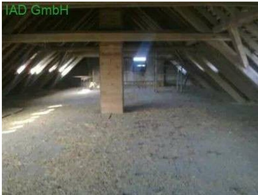
Kuhstall Dachgeschoss 3