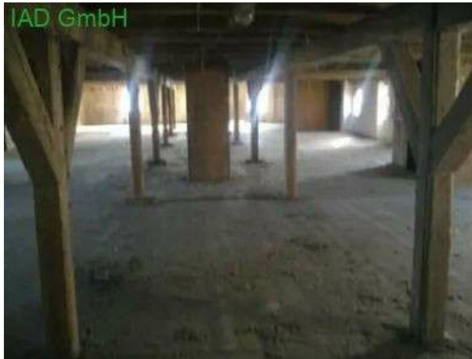
Kuhstall 1. Obergeschoss