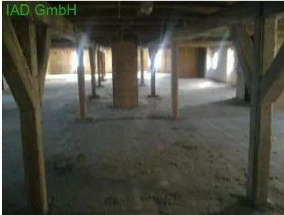
Kuhstall 1. Obergeschoss