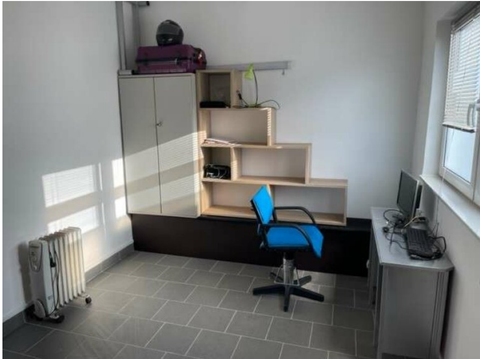
Büro bei Loft