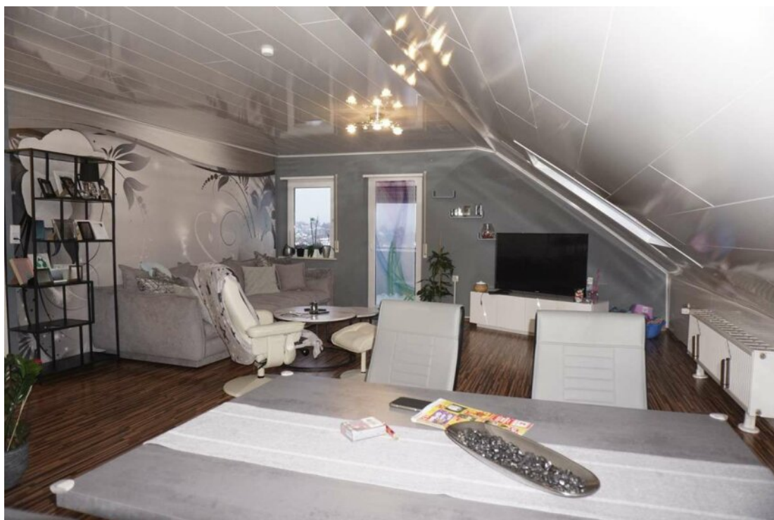
DG Wohn Essküche mit Balkon