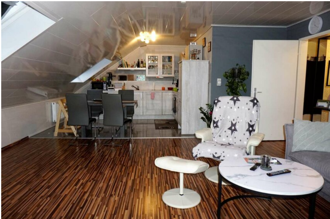
DG Wohn Essküche mit Balkon