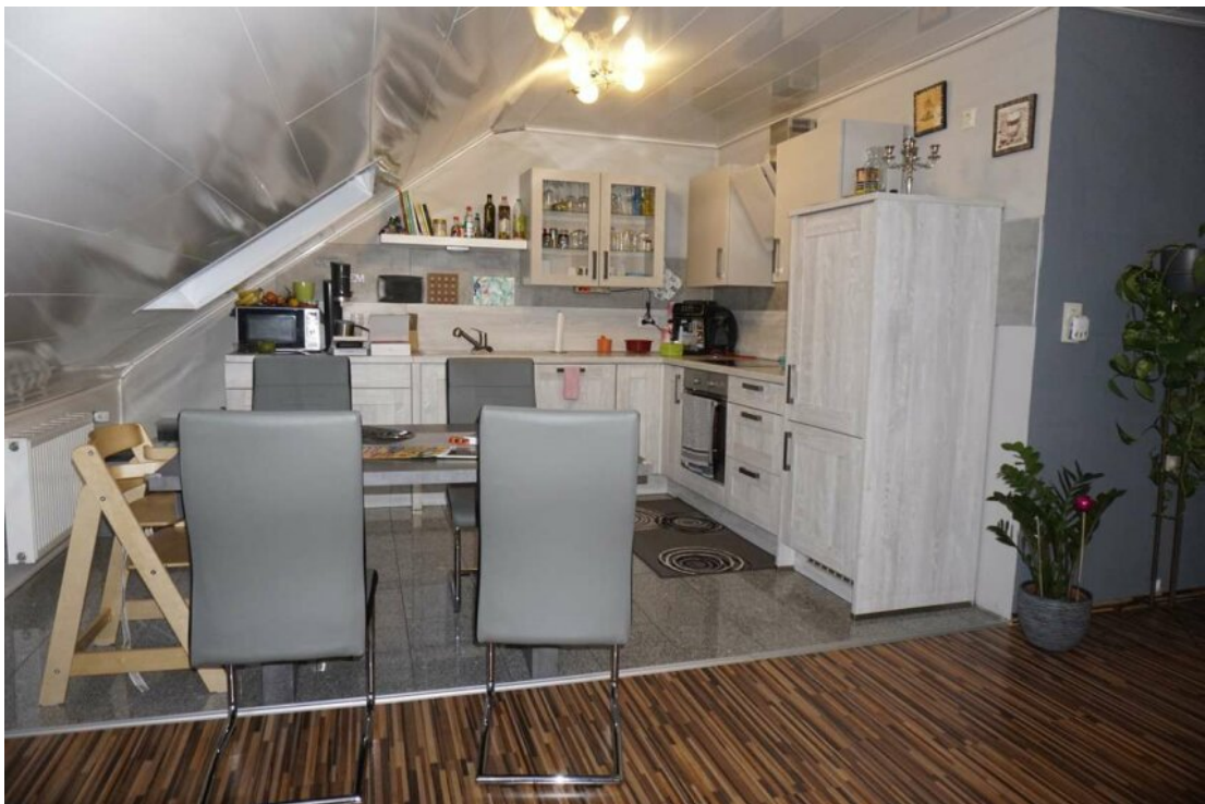
DG Wohn Essküche mit Balkon