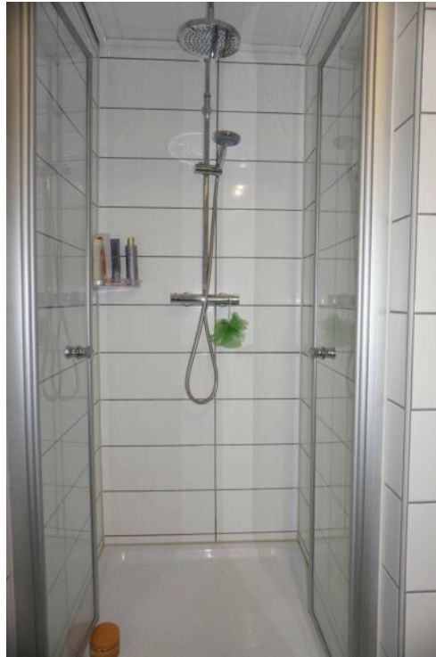
DG HWR Duschbad