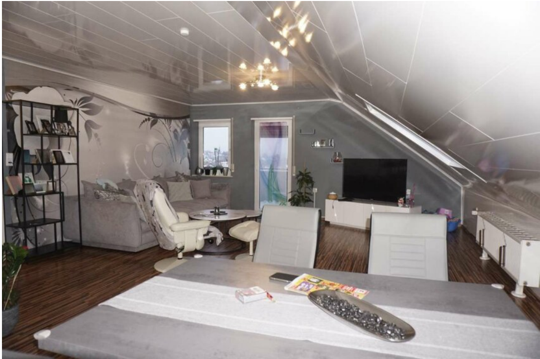
DG Wohn Essküche mit Balkon