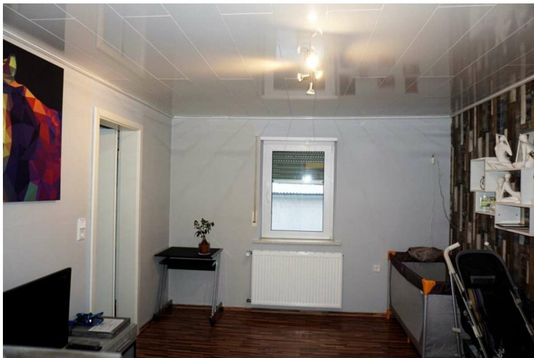
DG Büro oder Gäste mit Bad