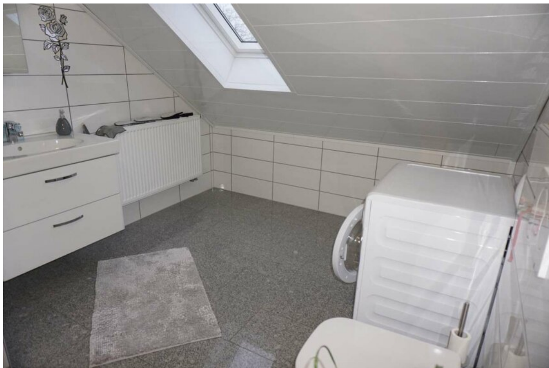
DG HWR Duschbad