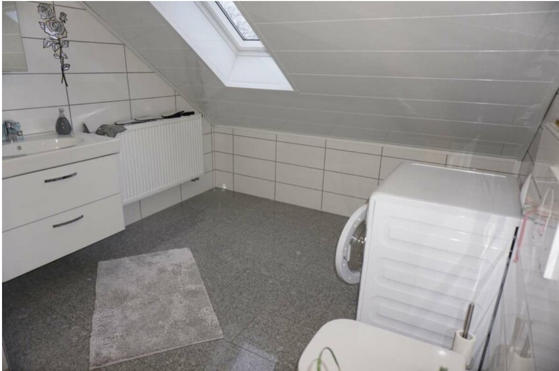
DG HWR Duschbad