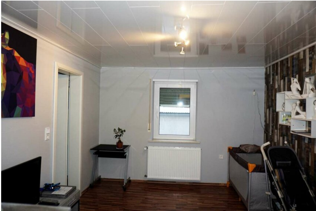
DG Büro oder Gäste mit Bad