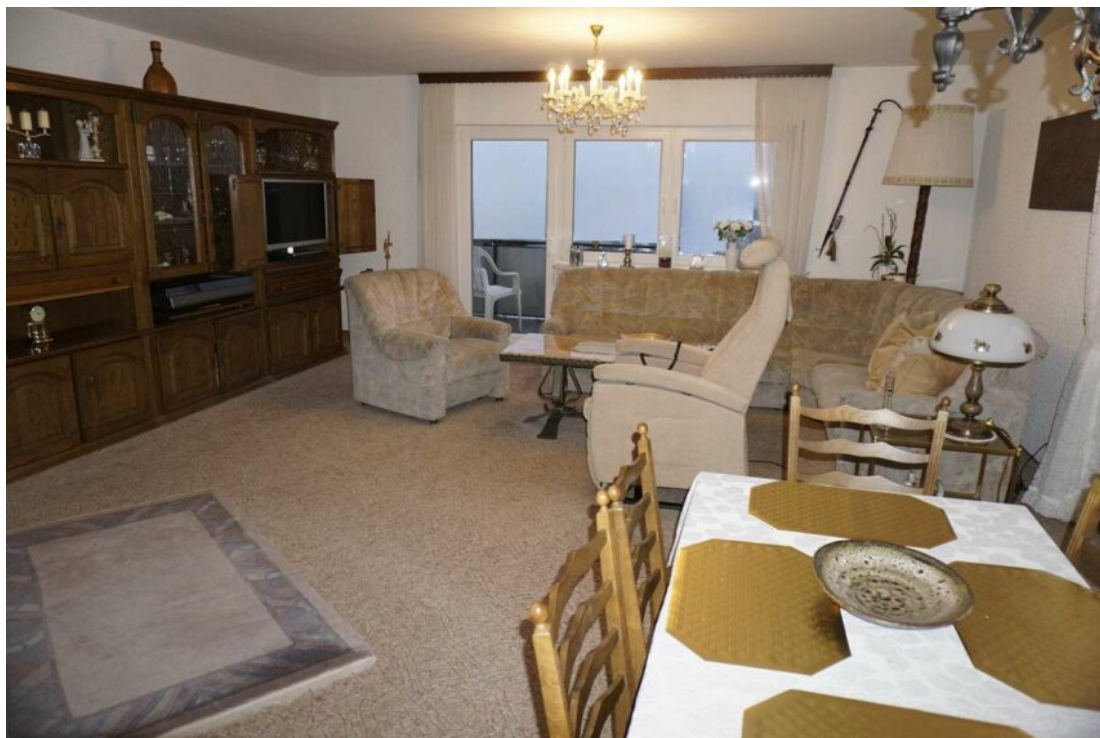
OG Wohn Esszimmer