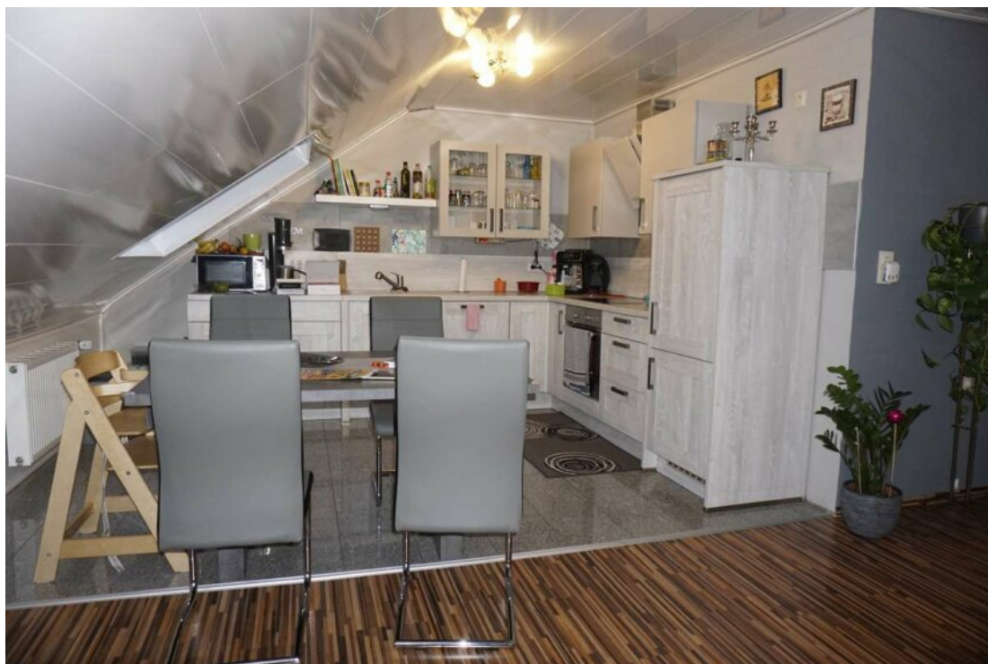
DG Wohn Essküche mit Balkon