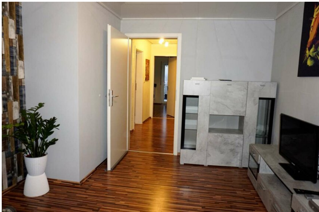
DG Büro oder Gäste mit Bad