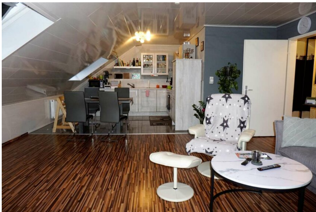
DG Wohn Essküche mit Balkon