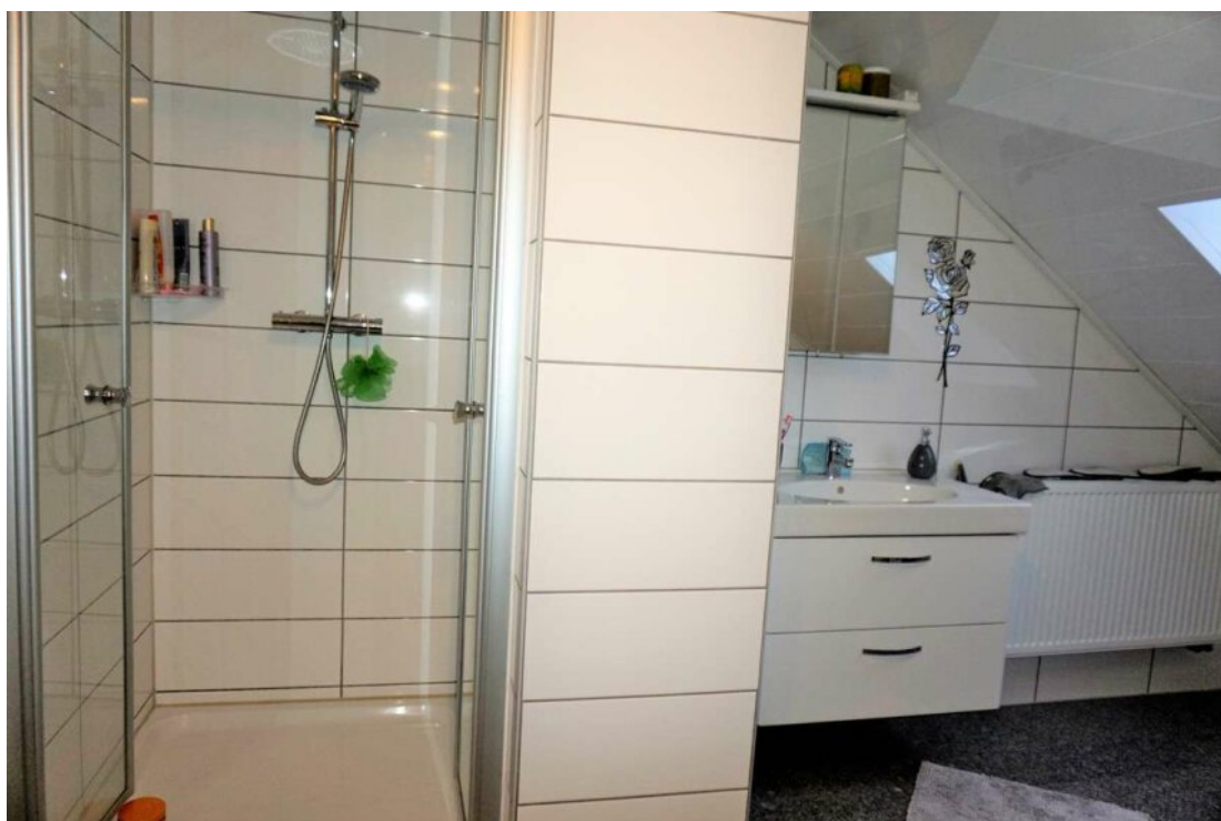
DG HWR Duschbad