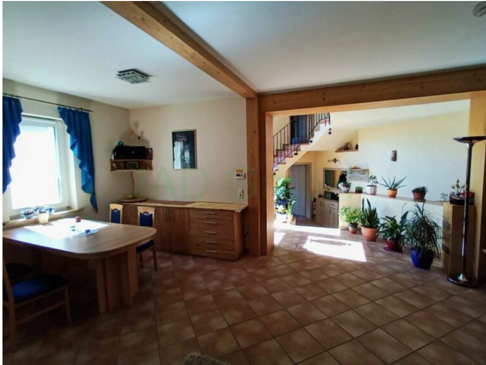
Essbereich mit Kamin