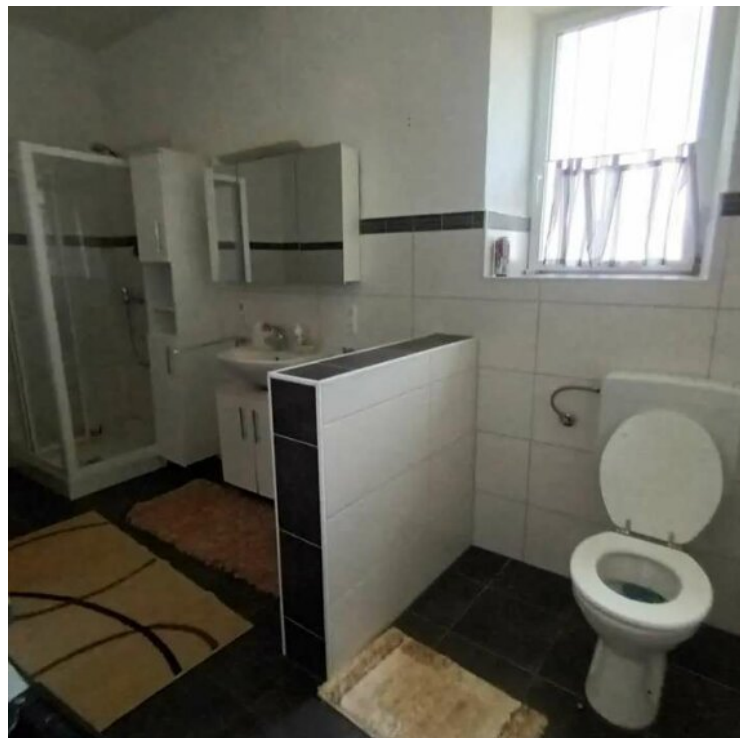
Bad + Toilette