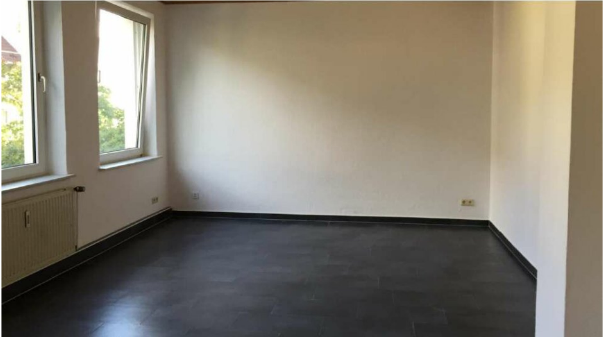
1. OG links