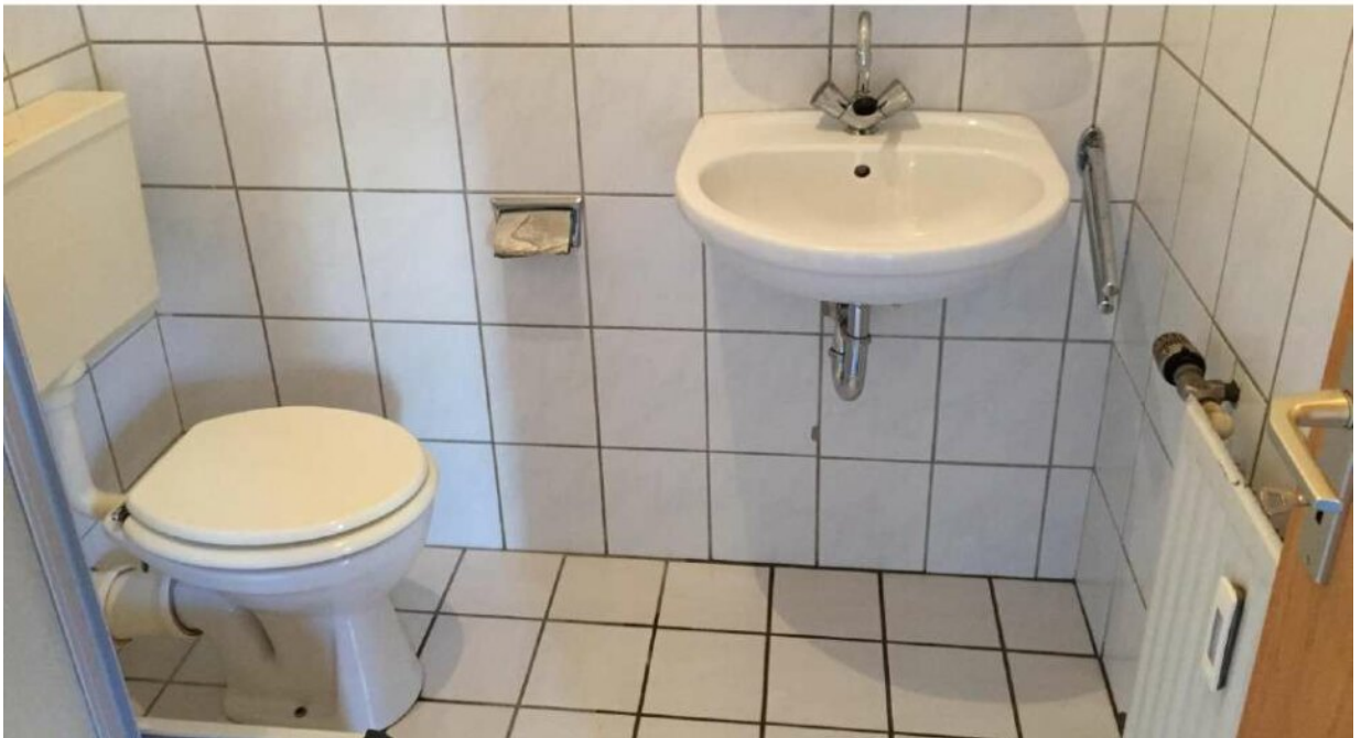
1. OG links