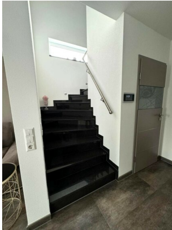
Treppe zum OG